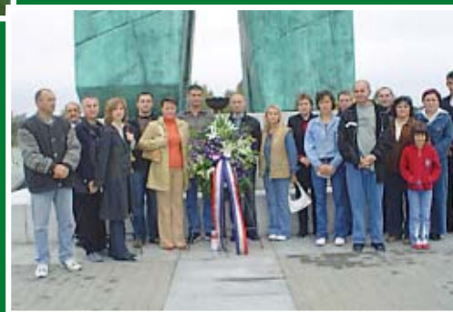
Kod križa "ŽRTVAMA ZA SLOBODNU HRVATSKU"...

Članovi podružnice policije PU Osječko-baranjske posjetili su 23. listopada Vukovar i u ovom hrvatskom gradu heroja i mučenika odali počast svima koji su položili život za Domovinu. Sindikalisti su obišli Trpinjsku cestu, centar Vukovara, Crkvu svetog Filipa i Jakova, gdje im je velečasni Slavko Antolić govorio o povijesti Vukovara i crkve, te o križnom putu koji su prošli Vukovarčani. Obišli su i Ovčaru, povijesnu kulu u Erdutu i crkvu u Aljmašu.