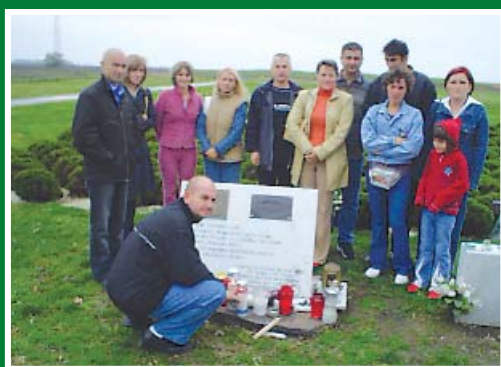
Na Novom groblju u Vukovaru