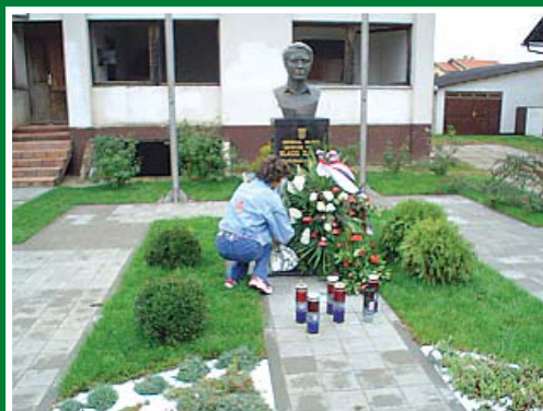
Počast Blagi Zadri na Trpinjskoj cesti...